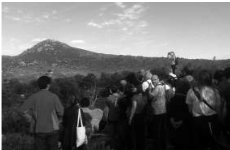
Participants del Congrés fent la visita a Can Torres de Vilartolí