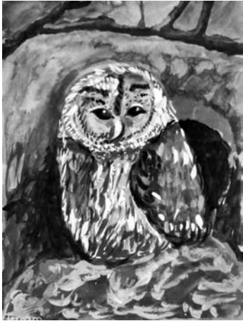
Categoria A "El savi del bosc" de Ferran Llobet Xartart