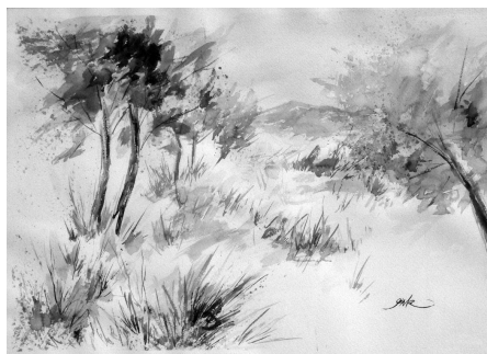
Categoria B Obra: Matí de tardor d'ALBERT GIMÉNEZ TORRENT