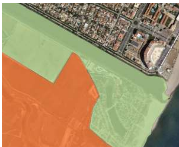
Fig2. Vissir ICC (vermell: reserva integral/verd: parc natural)