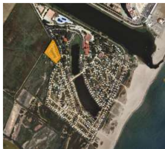
Fig.3. Zona del càmping que envaeix reserva Integral