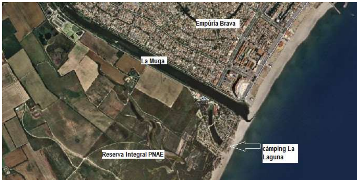
Figura 1. Ortofotomapa de la zona, on s'ubica el càmping La Laguna

És evident que l'ocupació d'un càmping en reserva integral, com a territori de màxima protecció a Catalunya, és una il·legalitat molt greu que cal que es posi remei d'una vegada per totes.